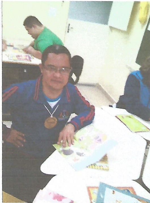
Festa da Família

INSTITUIÇÃO ALLAN-KARDEC - ALICE PEREIRA